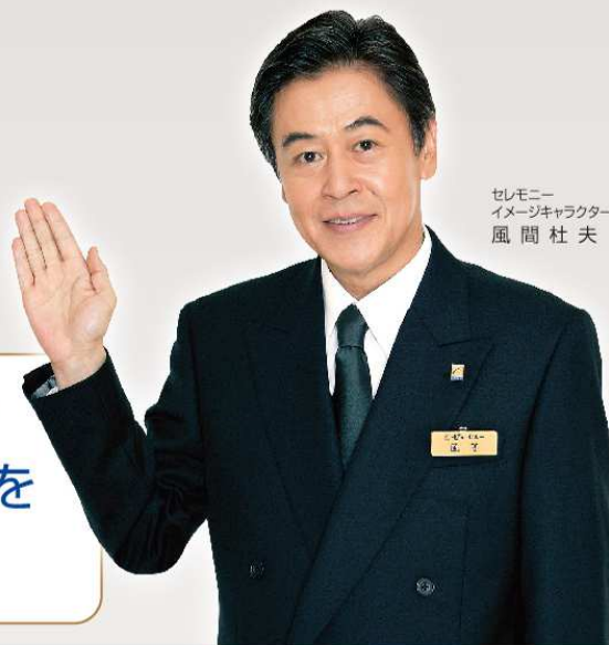
セレモニー イメージキャラクター 風間 杜夫

終活ブームの現在、ご葬儀の形態も多様化が進んでいます。 お葬式は初めてだから何からしていいのかわからないという方も多いのではないのでしょうか。 故人様をしっかりお見送りしたいという気持ちと、どのように進めていいのかわかるのか、ご葬儀の費用はどれくらいかかるのか、悩みを抱えることも多いかと思えます。だからこそ、「事前相談」や「事前見積」でお悩みやご不安を解消していただきたいと思います。 私たちセレモニーでは経験豊富なスタッフがお客様のお悩み・ご要望に応え、納得のいくご葬儀の提供を第一に考えております。